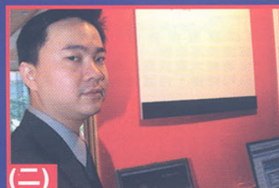
(二) Shaolin Aptus 2.0 伺服器 中央管理 Linux Desktop