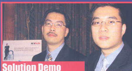
Solution Demo 一次更新所有 Patches Bigfix 中央集權安全管理方案