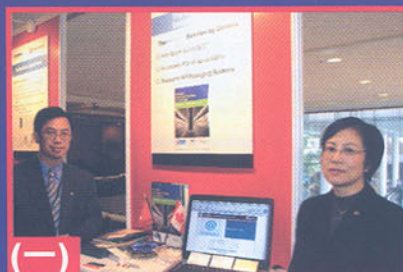
(一) 垃圾電郵認證新技術 eW@! 用最原始方法打擊Spam