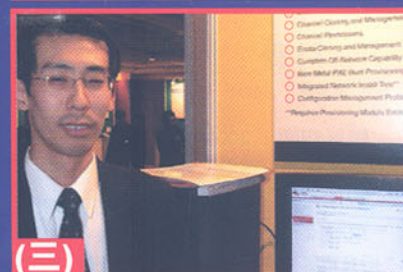
(三) Red Hat 的 SUS 伺服器 - RHN Red Hat Network modules